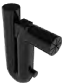
Přepadový sifon se zábranou proti hlodavcům