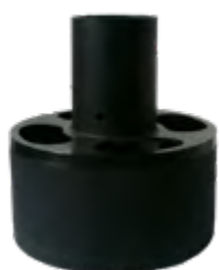
Zklidňovač vtoku bránící víření usazenin v nádrži