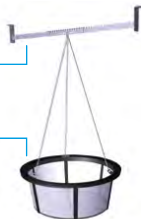
Filtrační koš s jemným sítem k zavěšení do šachty