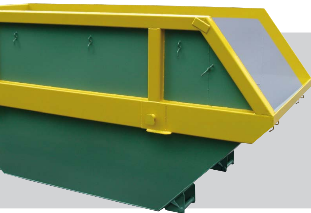
➔ Mulde mit Kunststoffdeckel

Standardmäßig werden die Container nach der Norm DIN 30720 hergestellt.