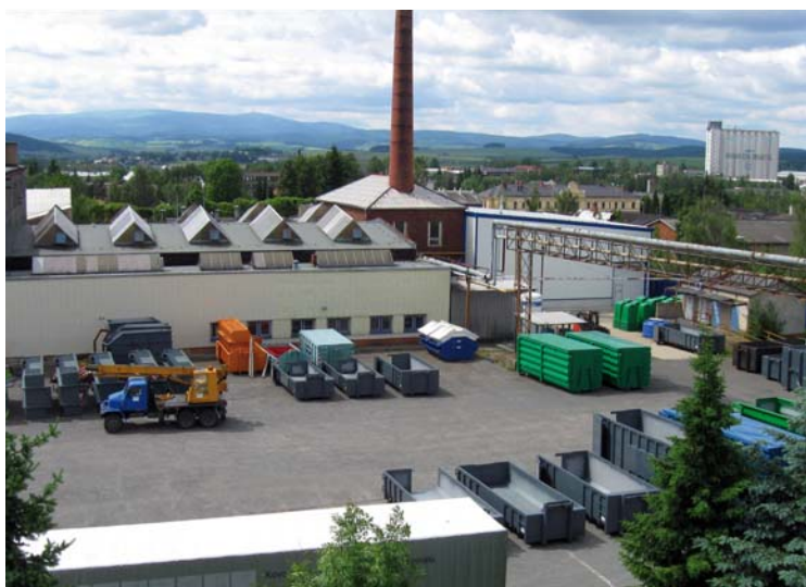
Produktionsräumlichkeiten in Bruntál

Durch Investitionen in die moderne Produktionstechnologie und durch Rationalisierung des Produktionsverfahrens wollen wir langfristig zur Sicherstellung des ökonomischen und sicheren Umgangs mit Abfällen beitragen.